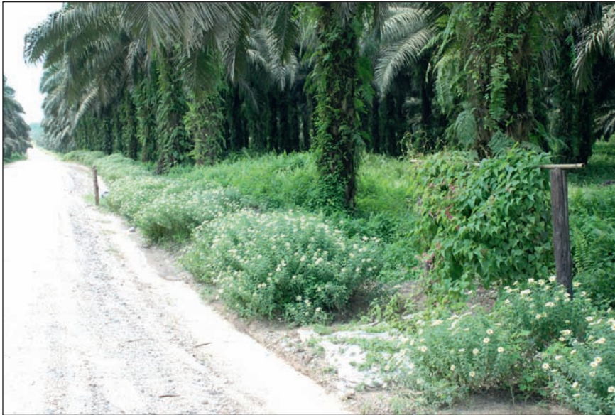
Figure 5. Plantes bénéfiques le long des chemins.

2) Faire vérifier par des organismes et experts indépendants l'existence, l'échelle et le cas échéant le contexte des erreurs commises par la compagnie citées dans les allégations des ONG.