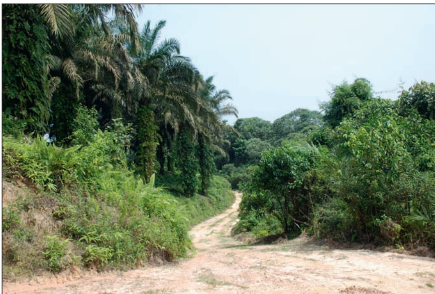
Figure 6. Zone de bas-fond conservée.

Singulièrement, RSPO fut relativement absente dans un premier temps du processus, alors que les allégations relevaient de critères émis par RSPO, alors que les premières sanctions furent émises par un membre fondateur de RSPO (Unilever) envers un autre membre de RSPO (PT. Smart), et qu'au sein de