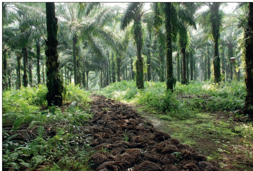
Figure 4. Recyclage de matières organiques en plantation.

La gestion de la nutrition minérale de l'ensemble des plantations de la compagnie relève d'un dispositif fondé sur l'association entre un programme expérimental comprenant un réseau d'essais de fertilisation de référence, et un suivi étroit de l'état de nutrition des arbres par analyse de tissu végétal (diagnostic foliaire annuel). Ce travail est effectué en collaboration avec le Cirad. Les pratiques de culture sont revues périodiquement afin de tenir compte des avancées technologiques et les connaissances agronomiques.