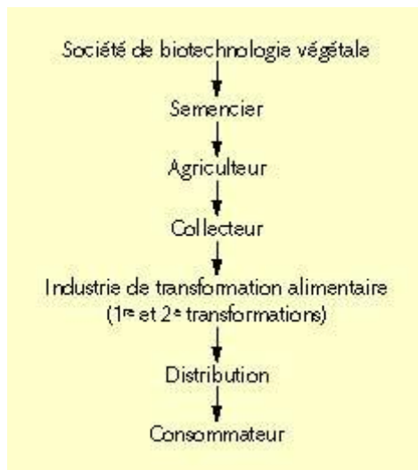
Figure 1. Les acteurs successifs du secteur alimentaire.