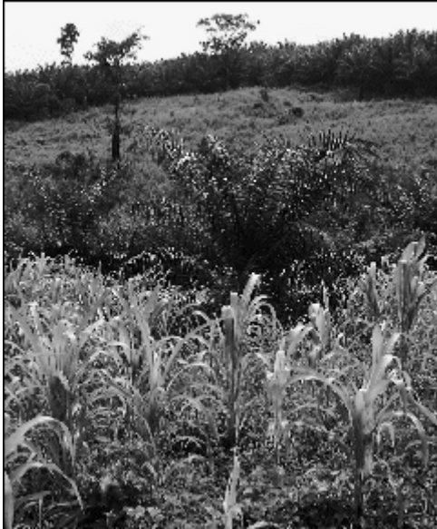
Photo 2. Association maïs et palmier.