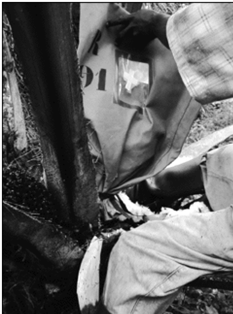
Photo 1. Fécondation contrôlée pour la sélection variétale : isolement d'une inflorescence femelle, station de la Dibamba, Cameroun.